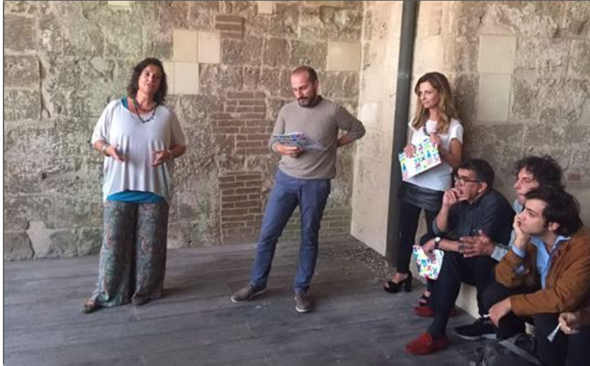
Un momento della conferenza stampa nella torre di San Pancrazio

Giovedì 10 Settembre alle 17:46 | di Manuela Arca