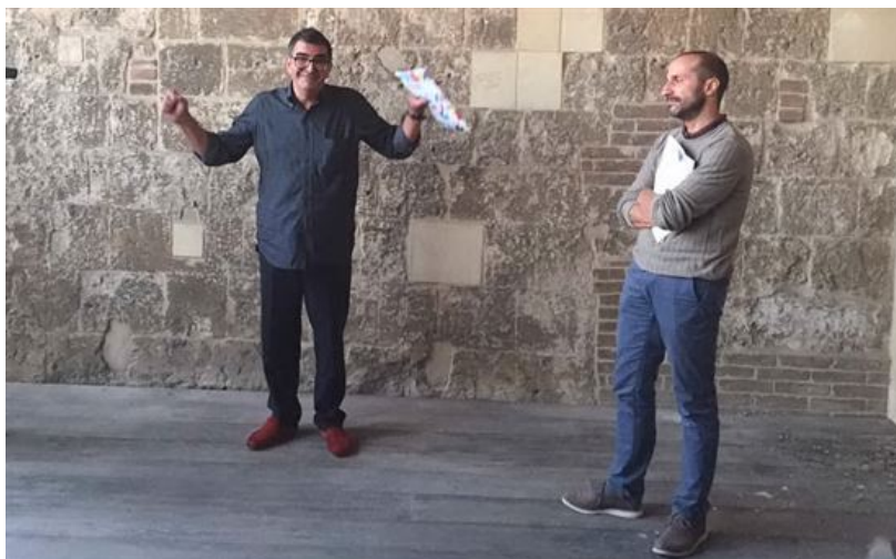
Un momento della conferenza stampa

Il Karel Music Expo, format dedicato alla diffusione di forme artistiche estranee alla grande distribuzione, apre il calendario. Si parte il primo ottobre e si chiude il 3. Il 7 ottobre prendere invece il via il Festival Spaziomusica, giunto alla 34esima edizione. Gli appuntamenti vanno avanti sino all'8 novembre. L'8 ottobre, all'ExMà, s'inaugura la decima edizione del Festival Tuttestorie dedicato alla letteratura per ragazzi. Nell'arco di 5 giorni sono previsti 250 appuntamenti. Attesi 80 ospiti. L'11 ottobre la parola passa alla compagnia Is Mascareddas, artefice della rinascita del Festival Animar. La manifestazione, in programma sino al 24 ottobre, si svolgerà tra il centro culturale Lazzaretto e l'ExMà. Gli spettacoli saranno portati in scena da maestri del teatro di figura.