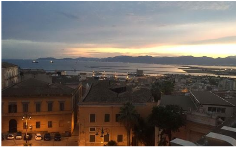
Il panorama dalla torre di San Pancrazio

Poi, con la regia di Massimo Mancini, direttore del Teatro stabile della Sardegna, i rappresentanti delle associazioni hanno dipanato i fili della rassegna.