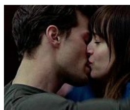
Ecco i 10 modi in cui gli uomini dicono Ti Amo, senza dirlo