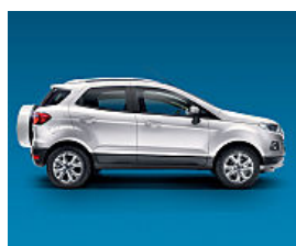
FORD ECOSPORT € 14.950 A MAGGIO GLI ECOINCENTIVI FORD...