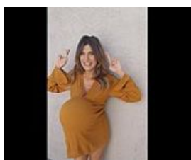
Elisabetta Canalis annuncia sul web: «Sono incinta, aspetto una bambina»