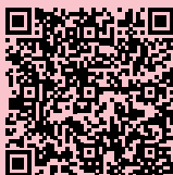
Saris & den Engelsman

Quota di partecipazione - 20€ Per iscriversi inviare una mail a biglietteria@sardeginateatro.it oppure completare il form online ↓