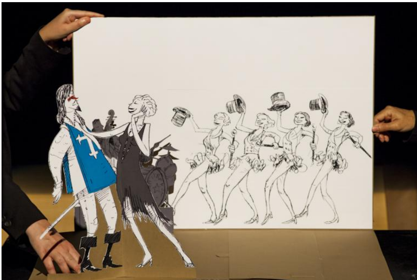
Sacchi di sabbia, ph Lucia Baldini.

di colore abbacinate, creature solari, “fanno teatro”, cioè qualcosa che è insieme molto evidente e molto nascosto. Lo scrivo qui per gli assessori che sul genius loci di Castiglioncello e del suo Castello, visibilmente concepito come una scenografia, rischiano di ingannarsi (così tanto che uno di loro, intervenendo a uno dei dibattiti in programma al festival parla di “territorio dei pittori” e cita “i vari Martelli, Lega”, dimenticando nella foga che Diego Martelli non fu mai un pittore ma un critico e un mecenate amico di pittori, un organizzatore di residenze artistiche ante litteram).