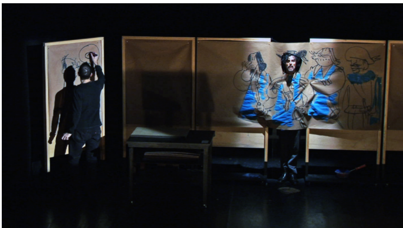
quattro moschettieri in America.