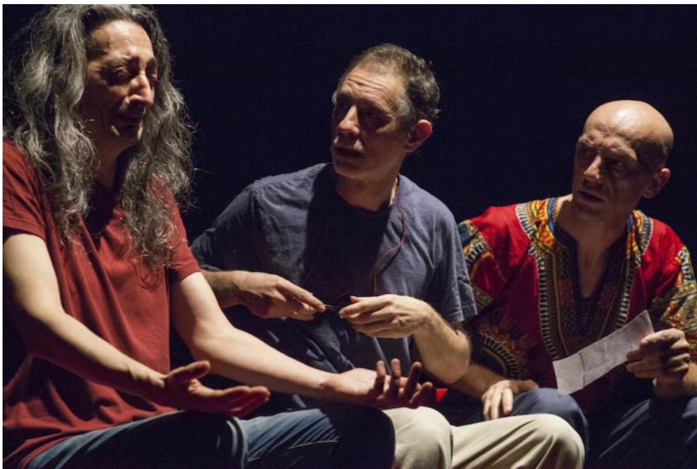
Freier Klang