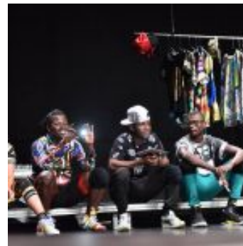
Kinshasa Electric