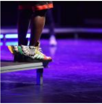
Kinshasa Electric