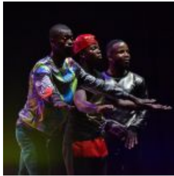
Kinshasa Electric