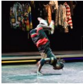
Kinshasa Electric, foto di Dietrich Steinmetz