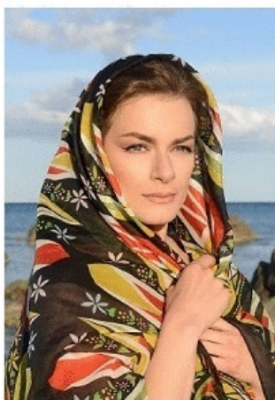
Pareo Joias Mod. dep.