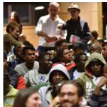
Kinshasa Electric