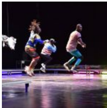
Kinshasa Electric, foto di Dietrich Steinmetz