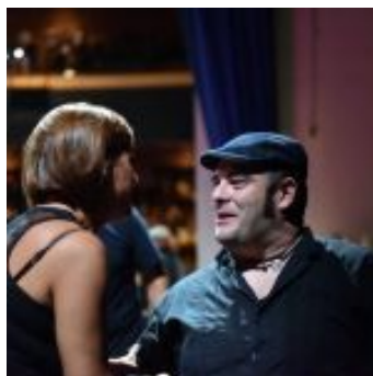
Kinshasa Electric