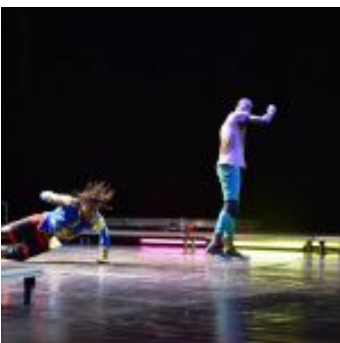
Kinshasa Electric