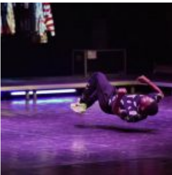
Kinshasa Electric