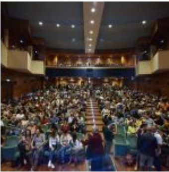
Kinshasa Electric