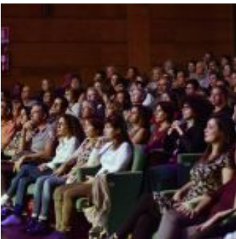
Kinshasa Electric