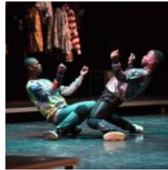
Kinshasa Electric, foto di Dietrich Steinmetz