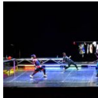
Kinshasa Electric

Lo spettacolo, nato da un progetto nella capitale del Congo, indaga indagare le connessioni culturali e gli scambi possibili in un mondo globalizzato. Ospite d'eccezione nell'ottica della contaminazione il polistrumentista sardo Gavino Murgia .