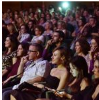
Kinshasa Electric